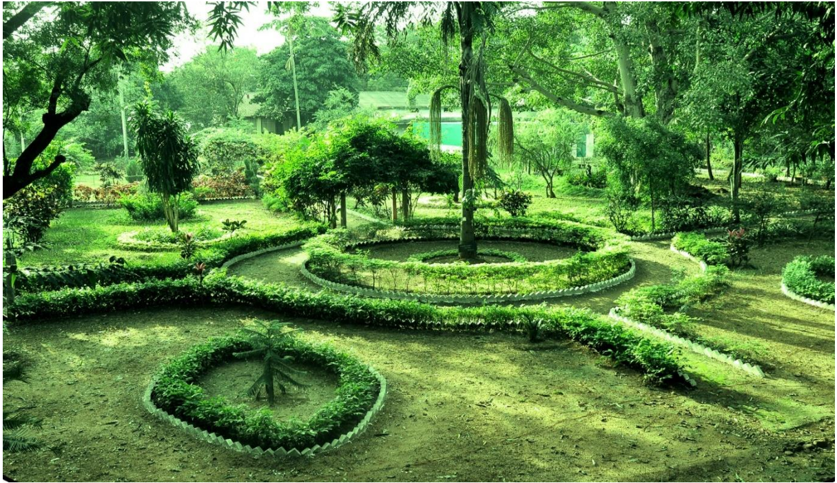
Greenery inside SVU Campus