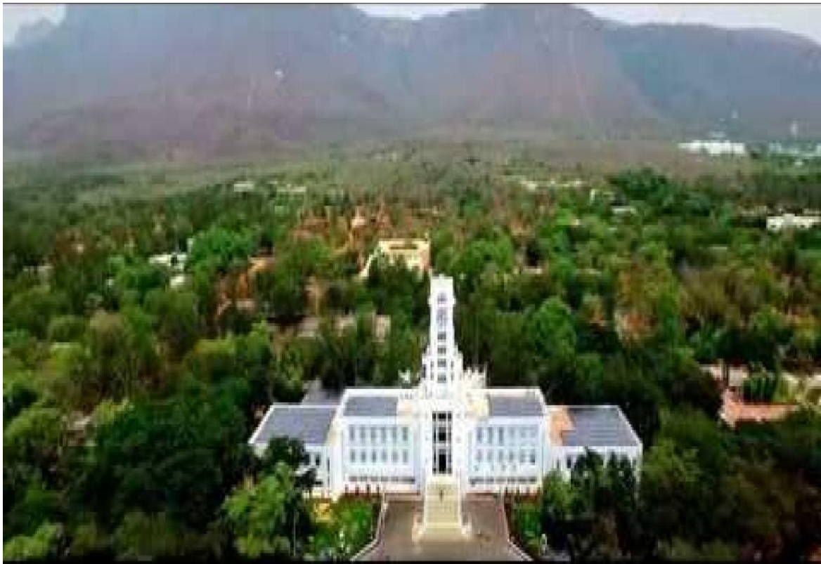
SVU Greenery (Overview)