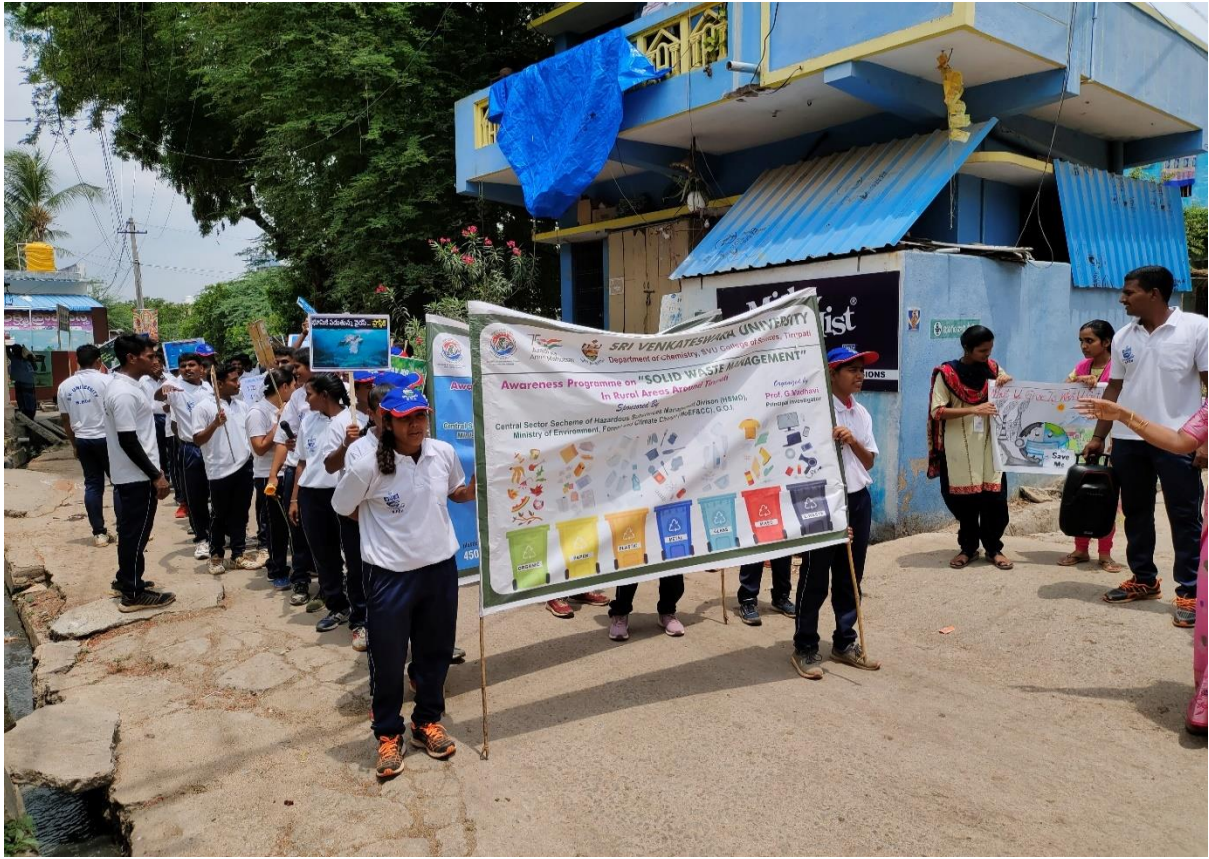
Awareness Programme - Ban on use of Plastic