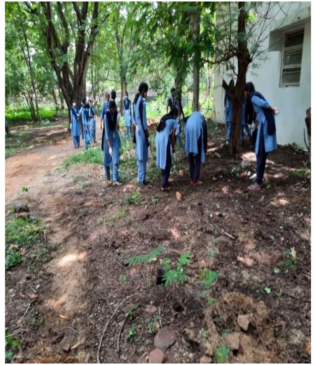
Clean and Green Programme