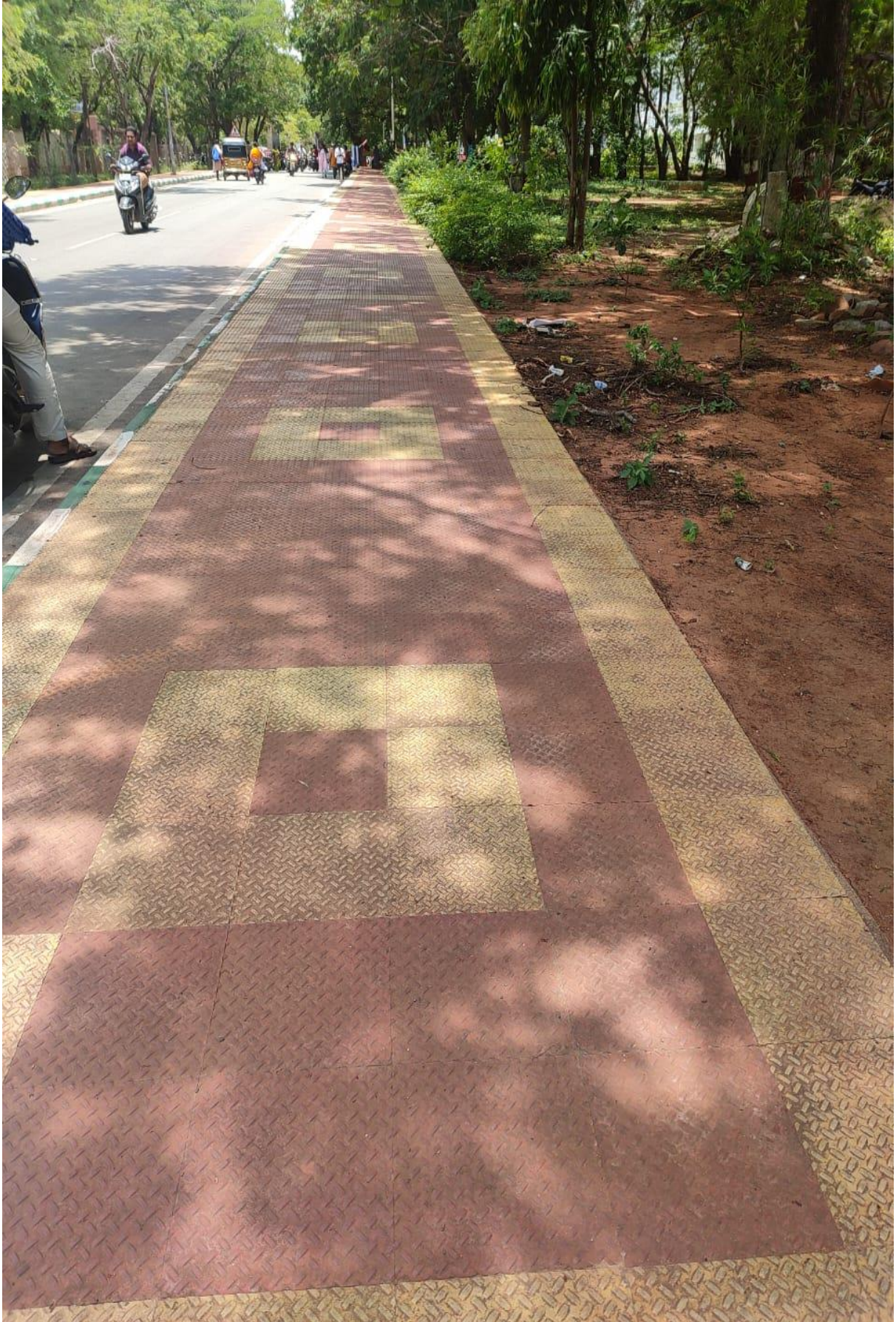
Pedestrian pathways in SVU campus