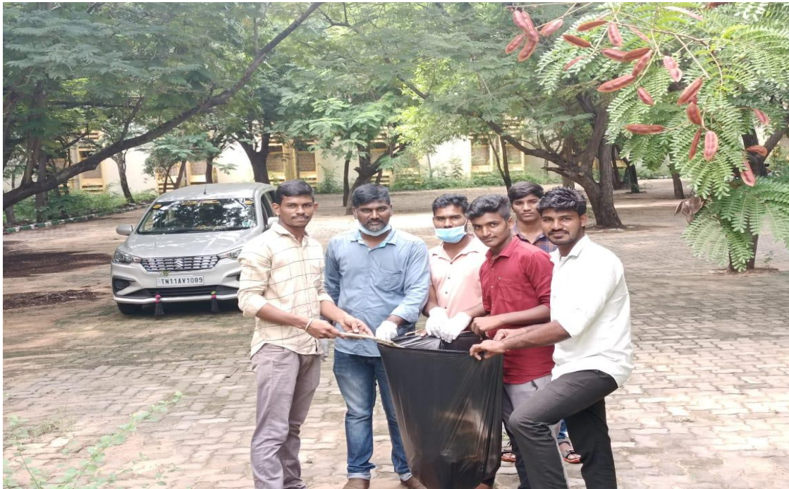
Plastics are removed by the students in a program