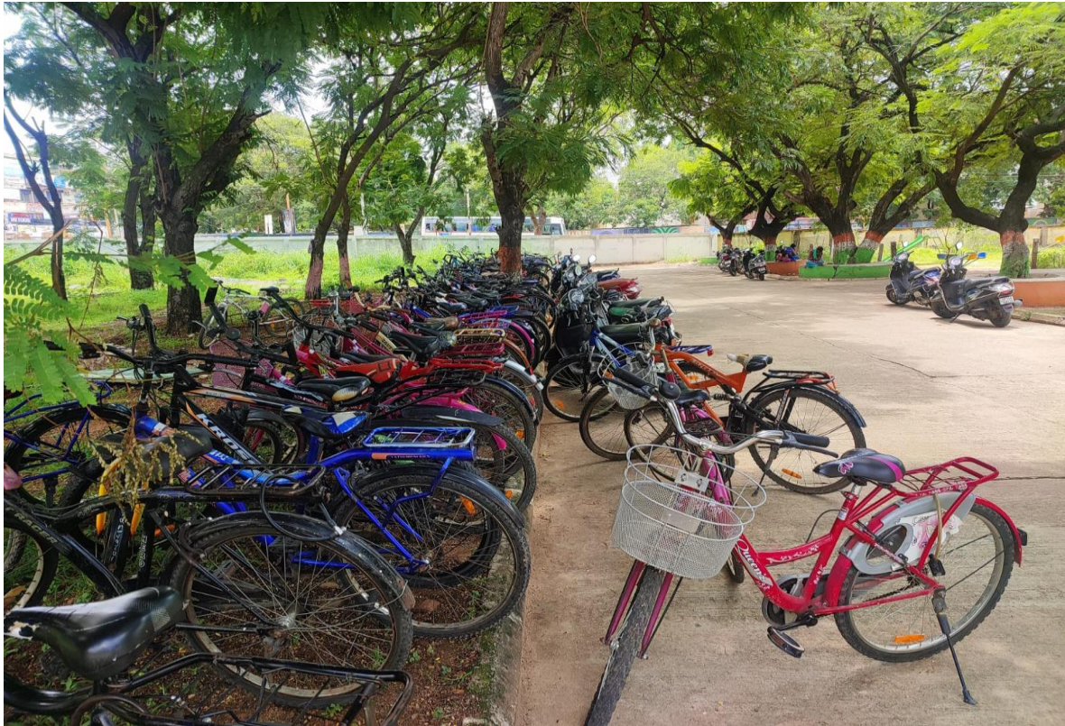
Use of Bicycles inside the campus