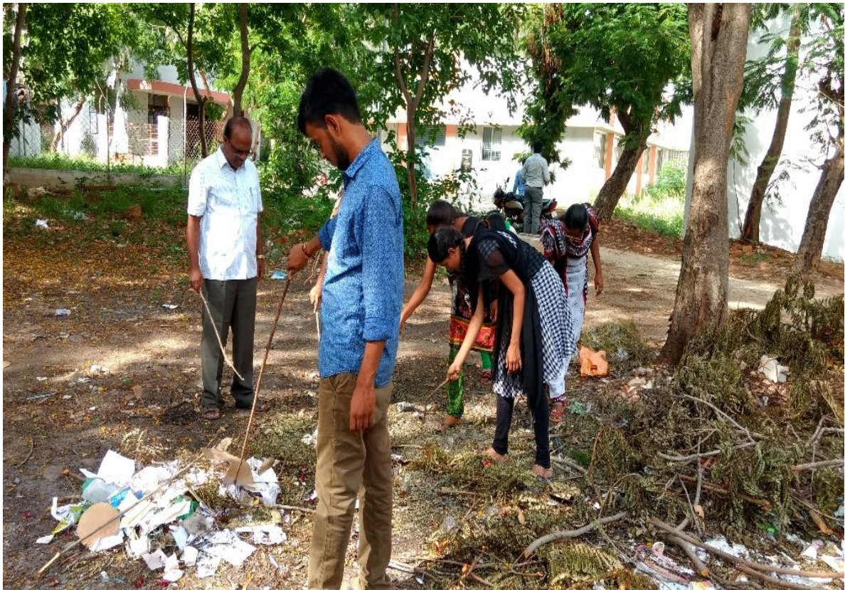
Plastics are removed by the students in a program