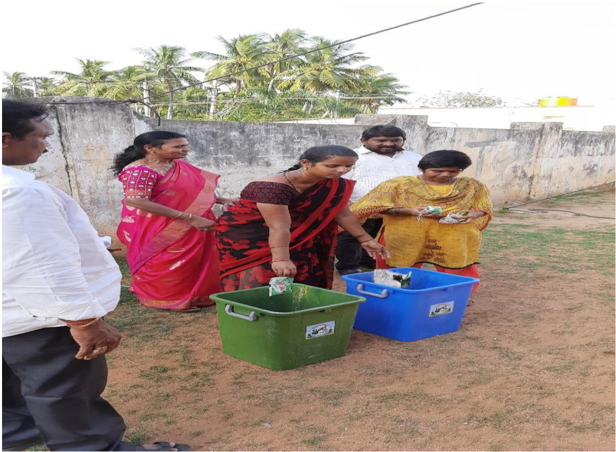
Throwing waste in respective dustbins