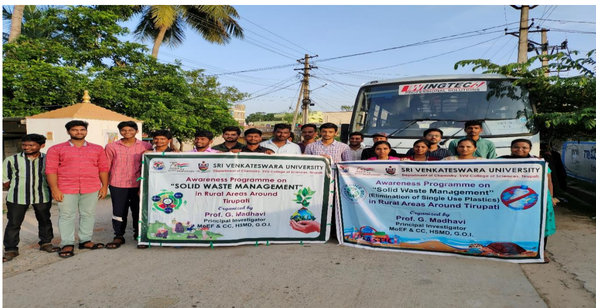
Awareness Programme on Solid Waste Management